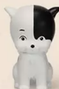
KEWPID DOG 小狗狗